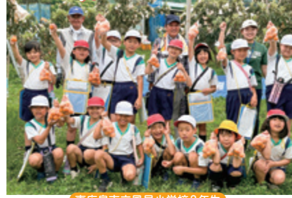
東広島市立風早小学校3年生