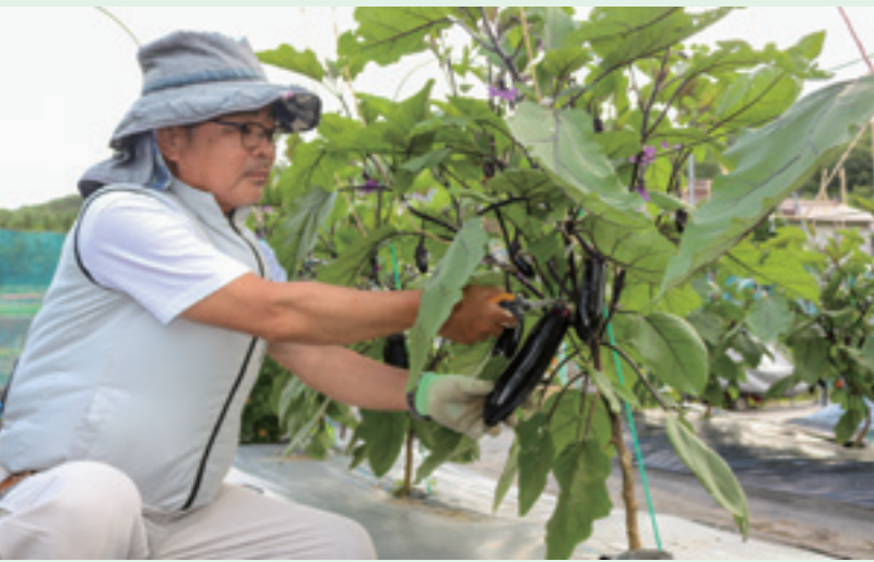
丁寧に中長ナスを収穫