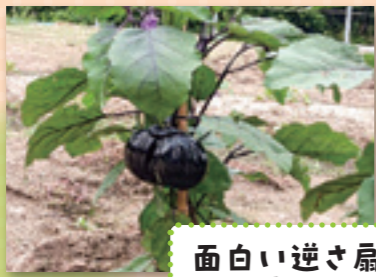
面白い逆さ扁のナスが 実りました 三原市 F・Mさん