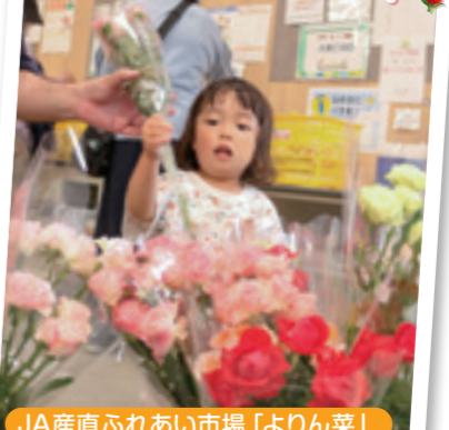
JA産直ふれあい市場「よりん菜」

ここまるが取材中に会った 『推し』な人や物を紹介します! ここまるの 推しフォト!