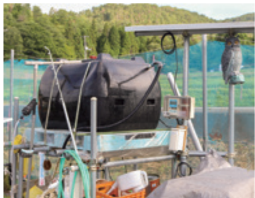
日射比例型かん水システム

東広島市や三原市、三次市などで栽培が盛んです。広島中央地域では、7月から10月にブランド「なす坊」として市場出荷します。黒紫色で果肉が柔らかく、ジューシーなのが特徴です。