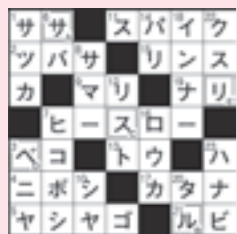
7月号の答え 「サルベリ」