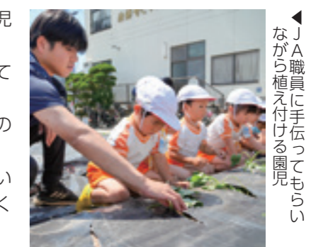
▲JA職員に手伝ってもらいながら植え付ける園児

JA職員が植え付け方をわかりやすく説明したあと、園児は手伝ってもらいながら、一生懸命に穴を掘って植え付けてペットボトルで水をやり、「おおきなあれ」と大きな声で願いを込めていました。