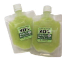
▲佐木島特産メロン「みどりの輝き」を使った「果実まるごとあらごしスムージー」

価格は1袋(100g)380円(税込)。パウチに入れて冷凍でJA産直市やさぶれあい市場三原店・本郷店などで販売します。