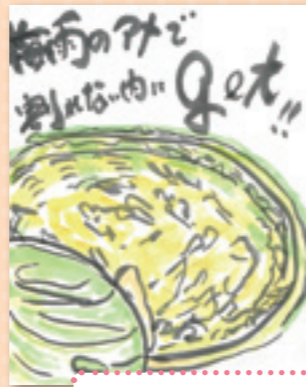
おいしくいただき ました 東広島市 造賀のおばあちゃん