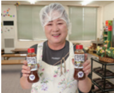
▲焼肉のタレをPRする女性部員

タレづくりは材料を調味料と一緒にミキサーにかけた後に加熱。翌日に容器詰めし、味をまろやかにするため1カ月間寝かせて完成させます。焼肉のタレは焼肉の他にも野菜サラダや温野菜、麻婆豆腐などで食べるのがおすすめです。焼肉のタレは三次市内外の産直市や地域のイベントなどで販売します。