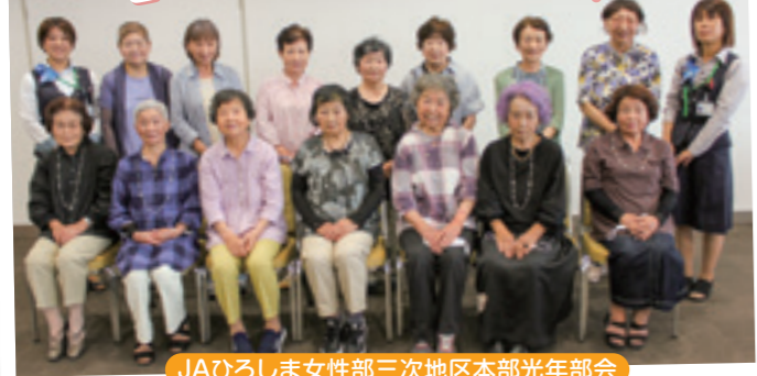
JAひろしま女性部三次地区本部光年部会