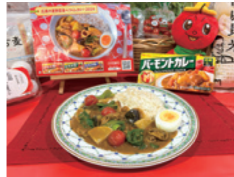
広島県の夏野菜をふんだんに使った「広島県の夏野菜食べつくしカレー2024」

「広島県の夏野菜食べつくしカレー2024」は、カレーの需要が高まる夏に合わせて、野菜の消費を後押ししようと企画。県産米「あきるまん」や和牛「元就」を使い、J Aが生産・販売に力を入れる、チンゲンサイや長ナス、ダイコンなどをトッピングしました。レシピでは、ナスやダイコンを炒め、チンゲンサイは茹でることで煮込み時間を減らして、調理時間を短縮。火を通すことで甘みが