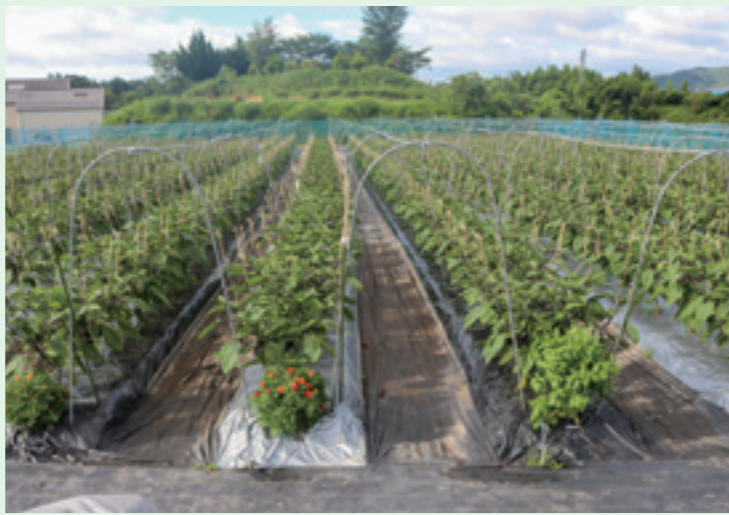
スイートバジルやマリーゴールドなどを混植する圃場